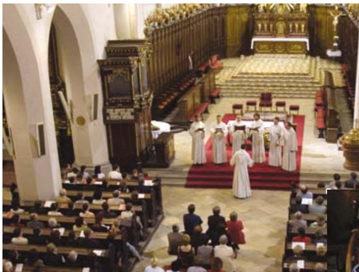
Schola Gregoriana Pragensis (17.9.2006)